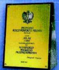
NAGRODA GOSPODARCA PREZYDENTA RP dla najlepszego polskiego przedsiębiorstwa w 2002 r.