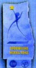
BUDOWLANA MARKA ROKU