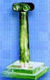
FILAR POLSKIEJ GOSPODARKI 2004 Nagroda przyznana przez „Pols Biznesu”