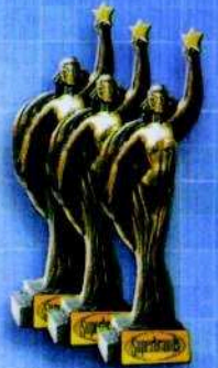
SUPERBRANDS NAGRODA EKSPERTÓW dla marki ATLAS